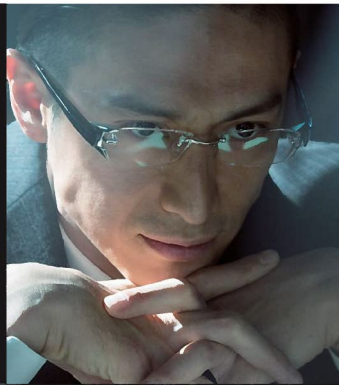
伊勢谷 友介 Yusuke Iseya