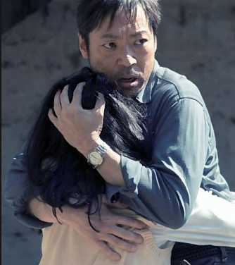
松坂 桃李 Tori Matsuzaka