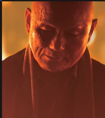
ビートたけし Beat Takeshi