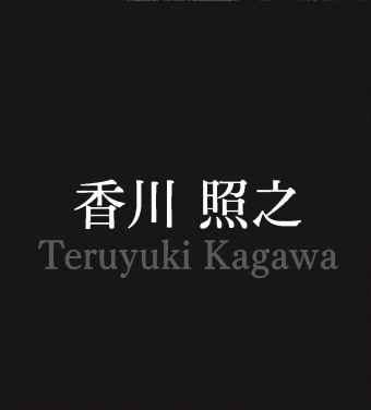
香川 照之 Teruyuki Kagawa