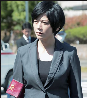
真木 よう子 Yoko Maki