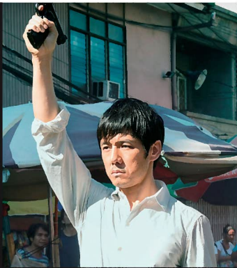
西島 秀俊 Hidetoshi Nishijima